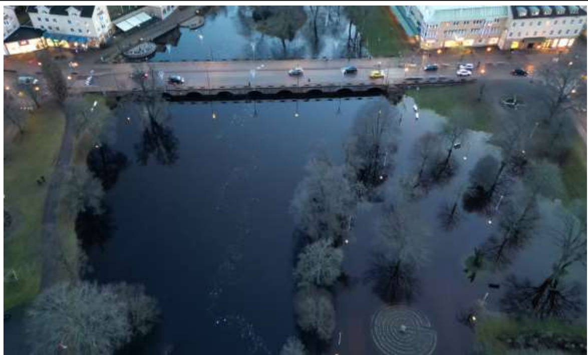
Figur 1 Översvämning i Åbroparken, filmat med geodataenhetens drönare 2023-01-16.

Antagen av nämnd: Samhällsbyggnadsnämnden